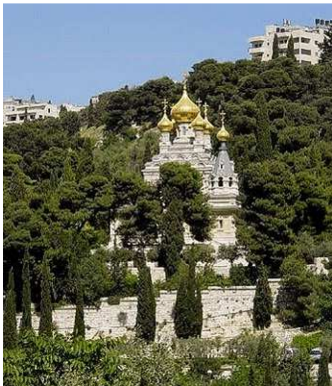
La Iglesia Ortodoxa Rusa de María Magdalena, ubicada en la ladera occidental del Monte de los Olivos.

simultáneamente la Tribulación y el Milenio ahora mismo y lo hemos estado haciendo así desde la Cruz. Estamos supuestamente en el Milenio porque el Espíritu Santo está restringiendo el mal por medio de la Iglesia. Y estamos simultáneamente en la Tribulación debido a que la Iglesia está sufriendo persecución.