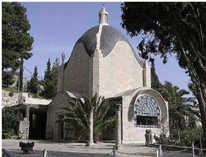
La Capilla Dominus Flevit está ubicada en la ladera occidental del Monte de los Olivos, cerca de la cima. El nombre significa, "El Señor Lloró" y por eso la iglesia fue diseñada por su arquitecto para que pareciera una lágrima. Se asienta en el sitio tradicional donde Jesús lloró por la ciudad de Jerusalén.

Josefo dice que los romanos mataron un millón de judíos en el asedio de Jerusalén del 70 A.D. Los historiadores están convencidos que este número es muy exagerado. Pero incluso si es cierto, no es nada comparado a los seis millones de judíos que perecieron a manos de los nazis.