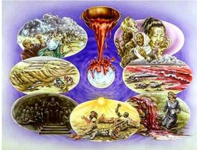
Imagen que muestra los juicios de las copas.

Considere nuevamente el versículo 21: " porque habrá entonces gran tribulación, cual no la ha habido desde el principio del mundo hasta ahora, ni la habrá ". ¿Quiso decir Jesús lo que dijo o no? Seguramente este no es un caso de hipérbole – de exageración para hacer un punto. Todo en el pasaje grita que debemos tomar las palabras de Jesús literalmente.