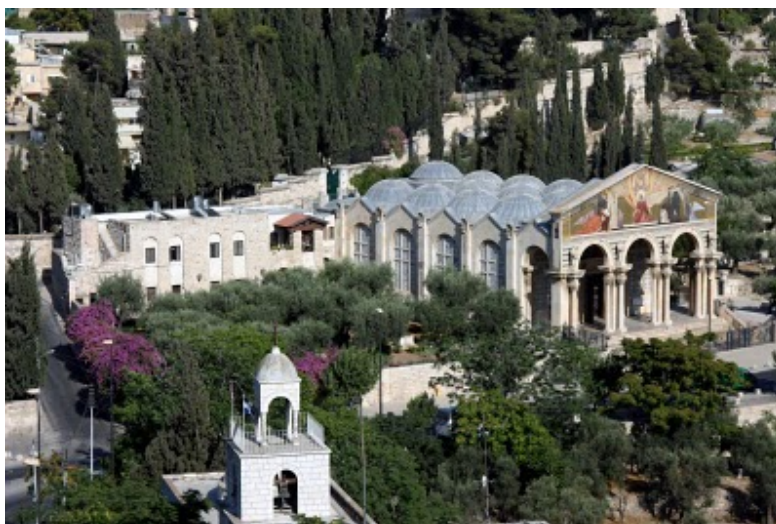
La Iglesia de Todas las Naciones se encuentra en la base del Monte de los Olivos, adyacente al Jardín del Getsemaní. Conmemora el sitio tradicional de la agonía de Jesús antes de su arresto

Pero esto no puede ser cierto. Podemos mirar alrededor de nosotros hoy y ver las señales precisas mencionadas en el Sermón del Monte. Ya están apareciendo en el escenario mundial.