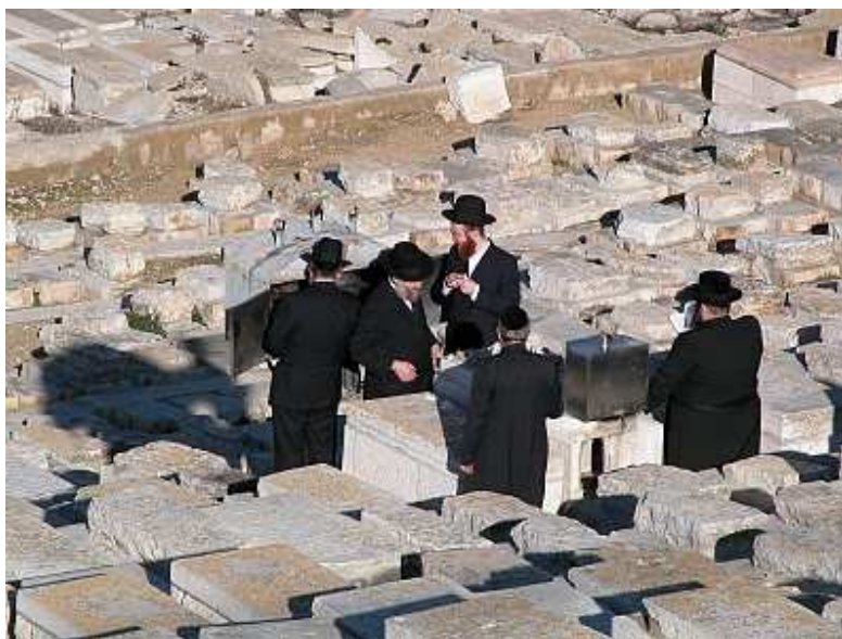
Judíos ortodoxos ocupándose de una tumba en el Monte de los Olivos.

Algunos niegan que la higuera tenga alguna relación con Israel en absoluto. Argumentan que todo lo que la parábola significa es que así como el florecimiento de la higuera es una señal de que el verano está cerca, así también, el advenimiento de todas las señales que Jesús mencionó será una indicación de que Él está pronto a volver.